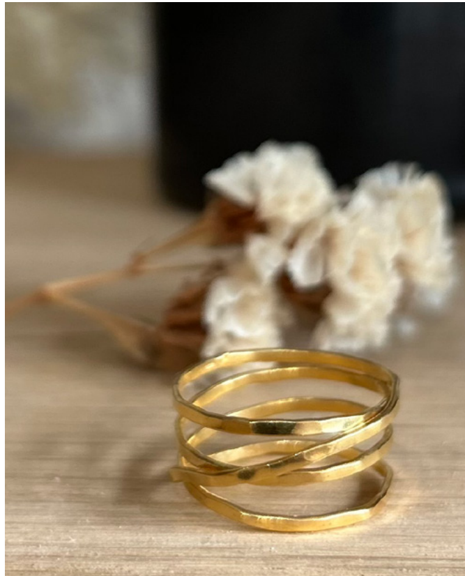
| collection en vermeil - argent massif plaqué or (5 microns) | vermeil collection - sterling silver gilded with 5 microns gold