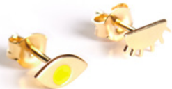
puces d'oreilles 04 stud earrings 04 40€