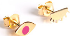
puces d'oreilles 05 stud earrings 05 40€